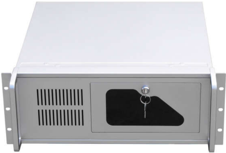
3、产品外形尺寸图：427×480×177mm（宽×深×高）